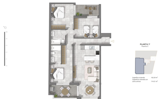
PLANTA C Planta C Superficie vivienda 102,20 m 2 Superficie vivienda con zona común 114,21 m 2